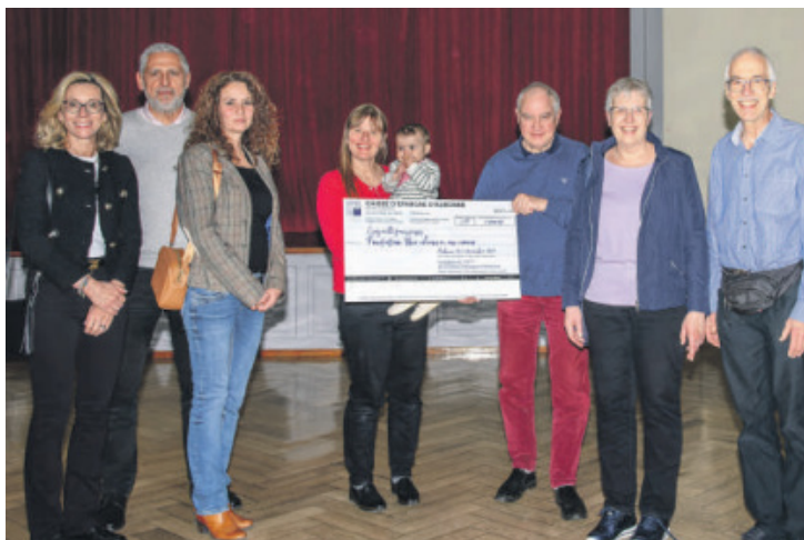
Cérémonie de remise du don de la Fondation du 175 ème anniversaire de la Caisse d'épargne d'Aubonne.

La Fondation continue de collaborer étroitement avec des professionnels de santé locaux et divers partenaires comme le Bijilo Medical Center en Gambie, l'hôpital Fann à Dakar ou la clinique "Swiss Visio" à Saly, qui jouent également un rôle clé dans la réception, la distribution des médicaments après chirurgie et le suivi médical des malades. En Suisse, les négociations avec TDH Lausanne et les HUG pour officialiser le transfert d'activités se poursuivent, témoignant de l'engagement continu de notre Fondation à assurer le traitement des patients déjà opérés en Suisse et ne pouvant être traités localement.